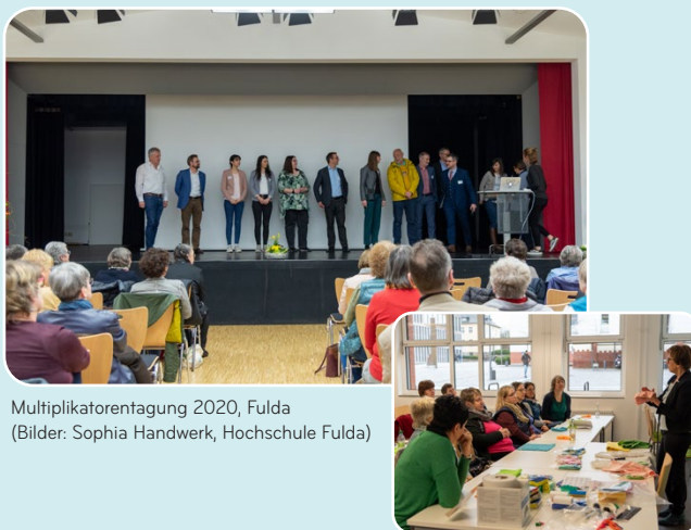
Multiplikatoren-tagung 2020, Fulda

Weitere Informationen zum Aktionstag und zur Multiplikatoren-tagung können beim Koordinationsbüro (siehe Herausgeber) erfragt werden oder können vom Internet abgerufen werden: www.forum-waschen.de/aktionstag-nachhaltiges-ab-waschen.html