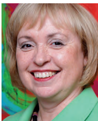
Prof. Dr. Maria Böhmer Beauftragte für Migration, Flüchtlinge und Integration der Bundesregierung