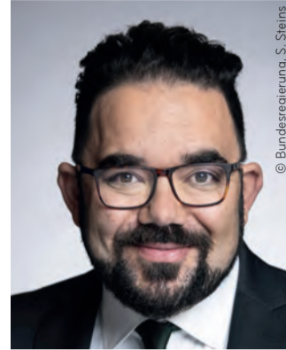
Christian Kühn Parlamentarischer Staatssekretär im Bundesministerium für Umwelt, Naturschutz, nukleare Sicherheit und Verbraucherschutz