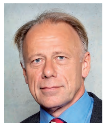
Jürgen Trittin Bundesminister für Umwelt, Naturschutz und Reaktorsicherheit