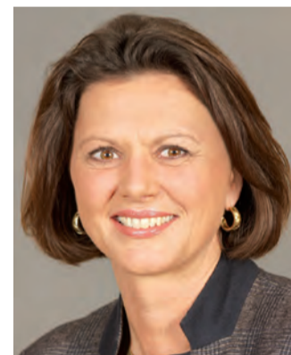
Ilse Aigner Bundesministerin für Ernährung, Landwirtschaft und Verbraucherschutz