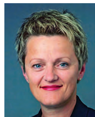
Renate Künast Bundesministerin für Verbraucherschutz, Ernährung und Landwirtschaft