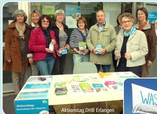
Aktionstag DHB Erlangen

Weitere Informationen zum Aktionstag und zur Multiplikatorenentagung können beim Koordinationsbüro (s. Impressum) erfragt werden oder sind über folgende Internetseiten zugänglich: http://forum-waschen.de/aktionstag-nachhaltig-ab-waschen.html